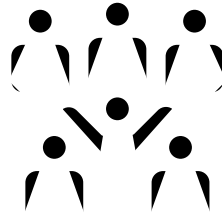
schéma des solidarités sociales pour coordonner l'action sociale